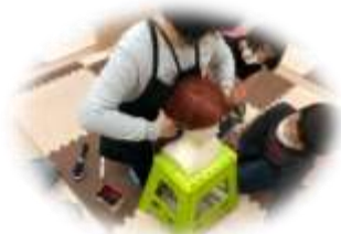
疑似職業体験 (美容師体験)

ごっこ遊びや模擬体験などを通して様々な体験をおこなったり、他己紹介など他者を知るための活動 外出支援を通して工場見学など幅広い活動・支援をおこなっていきます。