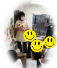
チクチク言葉とふわふわ言葉(SST)