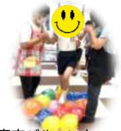
真空バルーンウォーク