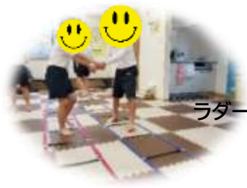
ラダートレーニング